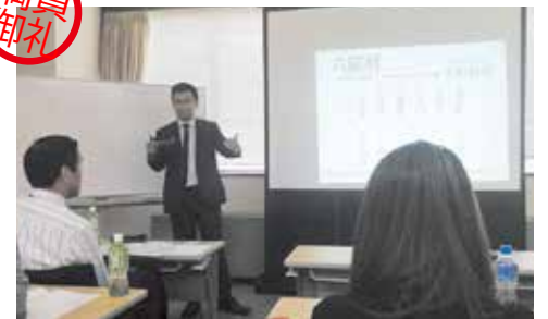
遺品供養士 2 級検定in広島