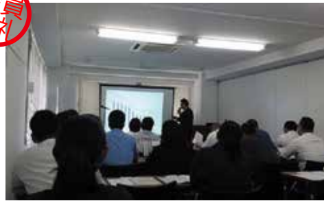
遺品供養士 2 級検定in東京