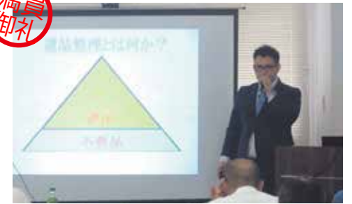
遺品供養士 2 級検定in東京