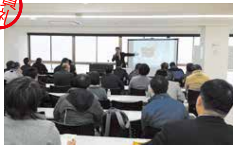
遺品供養士 2 級検定in大阪